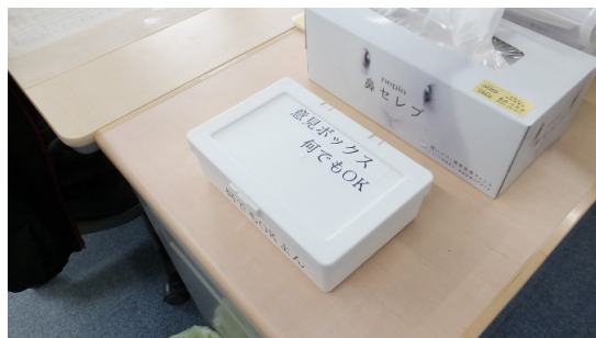
設置場所 経営者 ディスク